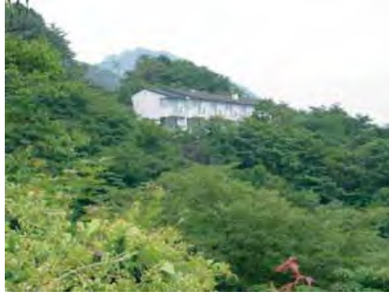
閑静なたたずまい