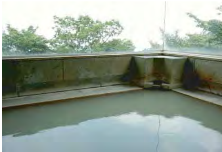
源泉掛け流しの白にごり湯