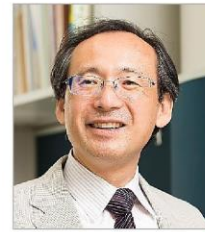
【講師】伊香賀俊治 慶應義塾大学 理工学部 システム デザイン工学科 教授

建築・都市の環境マネジメント第一人者である 伊香賀教授（慶應義塾大学）による講義と スマートウェルネス※体感パビリオンで実体験