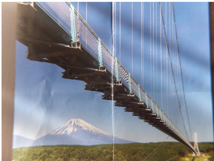
スカイウォーク(パンフレットより)