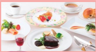
美味しいフレンチ料理