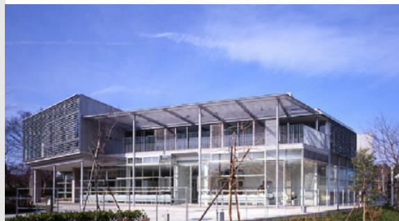
市沢地区センター