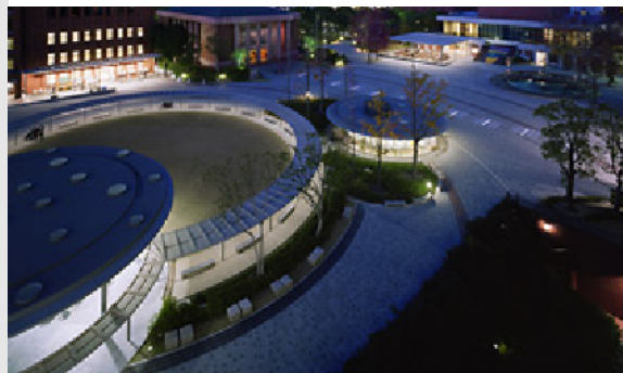
龍谷大学キャンパスの修景計画