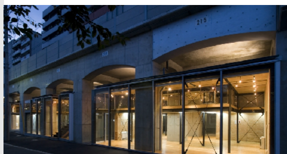
日の出町スタジオ