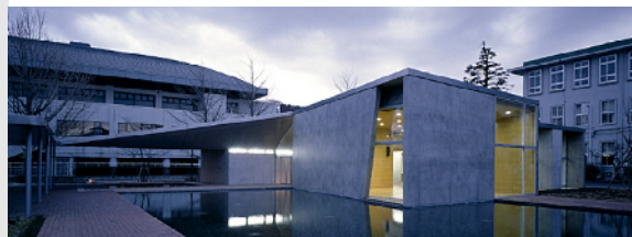
横浜市大交流プラザ