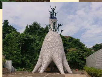
川崎市岡本太郎 美術館 母の塔

本書は、会員が選んだ“昭和”の建物等の紹介を中心に、県内各地区の街歩きマップも掲載しています。それぞれの地域には色々と魅力的な建物や寺社・史跡、お店があります。